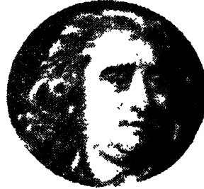
चार्ल्स जेम्स फाक्स